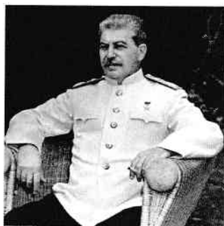
Iosif Stalin în timpul Conferinței de la Potsdam, 1945

fie asasinat. Începând din 1928 a pus în aplicare un plan de industrializare și un plan de colectivizare forțată, care au dus la numeroase arestări și execuții. În 1939 a semnat un acord secret cu Hitler pentru a împărți Europa de Est, dar când naziștii au invadat URSS în 1941, Stalin a decis să intre în război de partea Alianților. La Ialta și la Potsdam a reușit să își extindă influența și controlul asupra Europei Centrale și de Est, cu ajutorul așa-numitei Cortine de Fier.