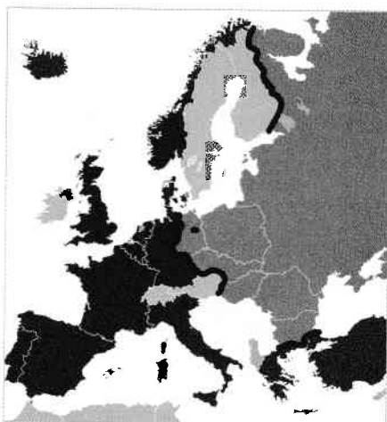
Hartă cu Cortina de Fier marcată cu linie neagră groasă

În scurt timp, formula „cortina de fier“ a fost înlocuită cu „cortina de oțel“, deoarece aceasta a fost asociată cu persoana care o crease: Stalin, „Omul de Oțel“. Din anul 1989, această „cortină“ a început să fie dărâmată, până la dispariția ei în 1991 odată cu prăbușirea URSS.