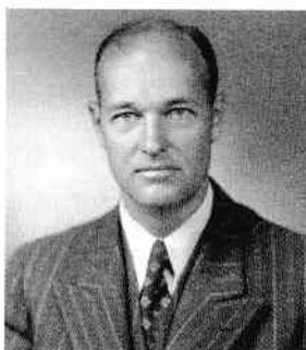
George F. Kennan în 1947

Pe măsură ce tensiunile cu Moscova au crescut, administrația americană a permis publicarea textului sub titlul „Sursele comportamentului sovietic” în revista Foreign Affairs în iulie 1947, sub pseudonimul „X”. Publicarea respectivului text a provocat una dintre primele dezbateri intense privind politica externă a SUA în noul context al Războiului Rece, dar este clar că abordările sale au devenit doctrina oficială a Statelor Unite ale Americii.